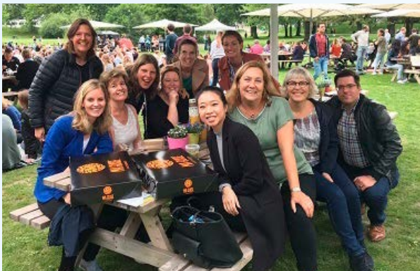
Het team van het Traumacentrum Zuidwest-Nederland wenst alle collega's uit de regio een mooie zomer en fijne vakantie toe!

De traumaregistratie van het jaar 2017 is afgerond. De cijfers worden weer gepresenteerd in de jaarrapportage. In het najaar verschijnt een nieuwsbrief die geheel in het teken zal staan van deze traumaregistratie.